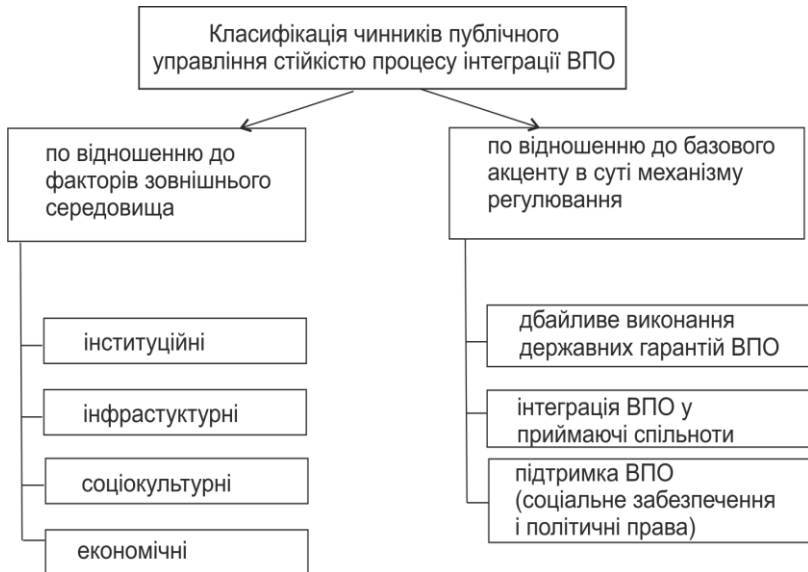
Рис. 2. Дефрагментація факторів публічного управління стійкістю інтеграції ВПО у приймаючі спільноти (складено автором)

Для підвищення ефективності процесів публічного управління стійкістю необхідно дефрагментувати елементи її забезпечення. Для цього приготовлена класифікація чинників публічного управління стійкістю процесу інтеграції ВПО за двома критеріями: а) по відношенню до факторів зовнішнього середовища (загроз) і б) по відношенню до базового акценту в суті механізму регулювання (гарантуючий механізм, механізм інтеграції, підтримуючий механізм) (рис. 2).